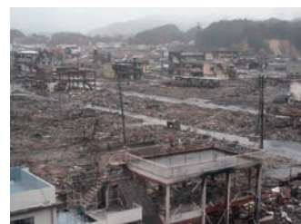
津波の災害 (東日本大震災2011年)