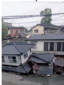
地震による倒壊 (熊本地震2016年)