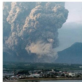
噴火の災害 (有珠山噴火2000年)