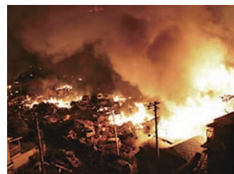
地震による火災 (東日本大震災2011年)